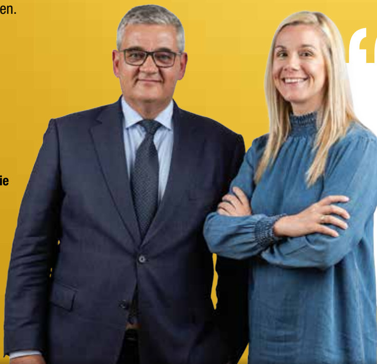
Steven Vandeput Minister van Defensie Lijstduwer

In Limburg winnen we dankzij de hervorming van de provincie 7 miljoen euro per jaar. De belastingen kunnen dus voor iedereen naar omlaag.