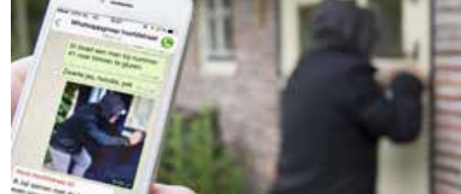
Vijfde buurtpreventienetwerk in Bree p.3