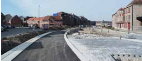
Wegenwerken in laatste rechte lijn p.2