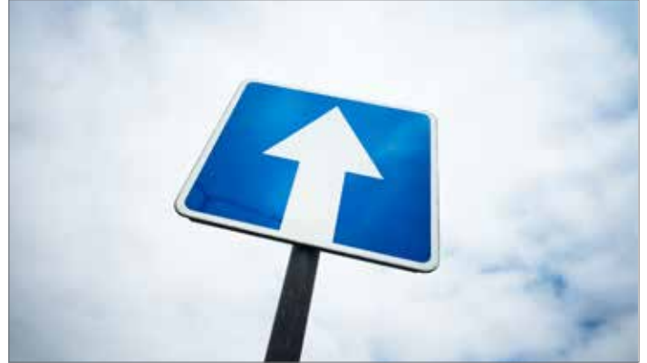
▲ Éénrichtingsverkeer aan de Witte Torenwal is slechts één van de vele aanpassingen die het Breese verkeer veiliger zullen maken.

De werken in de centrumstraten staan ingepland voor de zomer van 2019. Om de hinder voor handelaars en bewoners zo beperkt mogelijk te houden, gebeuren de werken in 15 fasen. De volledige uitvoering van de werken in de centrumstraten zal ongeveer 225 werkdagen in beslag nemen.